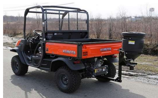
ATVS16 lt 60