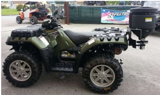
ATVS15A lt 60

Gli spargitori SaltDogg® della serie ATVS sono completamente indipendenti e ultra-durevoli, la struttura principale e' in Polyethylene anticorrosione. Il design robusto, consente l'uso di sale o di miscela sale/sabbia. Si montano facilmente su piccoli mezzi.